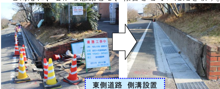
東側道路 側溝設置

いずれも、四万十市役所まちづくり課の事業で、学校を、児童を思う心ある要望と対応に、心から感謝をし、報告させていただきます。