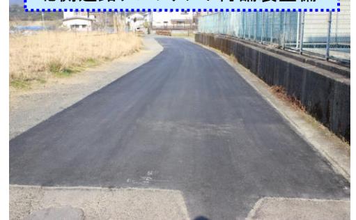
北側道路アスファルト再舗装整備