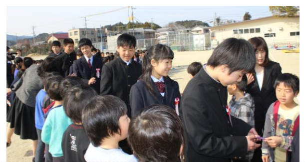
1・2年生から手作りのメダルと手紙のプレゼント

“卒業式は最後の授業”心も身体も態度も立派に成長した6年生は、入場時の深々とした礼に始まり、担任の先生へのサプライズメッセージ後の退場まで、安定感のある凛とした態度、式の中の感動や感激を心に刻むような素直で爽やかな態度で、節目となる卒業式を立派にこなしました。練習を重ねる度に、気分も姿勢も表現（歌や呼びかけ）も高まってきた在校生も、最後まで素晴らしい態度で、卒業生を心から祝福していて、式が引き締まりました。卒業生のリクエストで復活したお別れの歌「旅立ちの日に」では、心に響く村上 紀子先生のピアノの音に乗せて、全児童の美しいハーモニーが体育館に快く響き、心震えました。